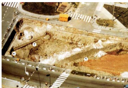
Fig. 9. Vestiges des remparts découverts en 1981.

Les principales transformations de la structure urbaine vont se dérouler au 19 e s.. Bien que la compétence en matière d'urbanisme soit attribuée à la commune depuis le Moyen Age, le premier règlement communal complet sur les bâtisses n'est apparu qu'en 1865. Il fait partie d'un ensemble de mesures destinées à moderniser la ville dans des perspectives d'urbanisme haussmanniennes. A partir de 1861, les remparts furent définitivement arasés et remplacés par des boulevards qui en suivent le tracé. Le creusement de tunnels sous ces boulevards dans les années '80 a mis au jour les vestiges des murailles conservées en sous-sol. La destruction des murs avait notamment pour objectif d'ouvrir la ville au développement intense que connaissait le bassin houiller du Borinage. Attachée à sa vocation religieuse, militaire, juridique, académique et commerciale, la ville demeura néanmoins à l'écart de cette expansion industrielle. Les nouveaux quartiers nés de son ouverture sont principalement résidentiels.