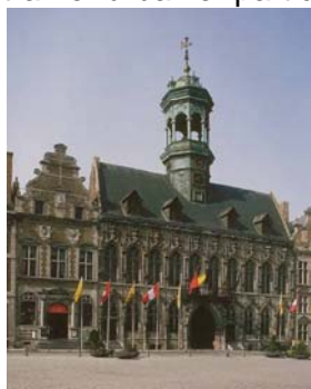
Fig. 3. La Grand-Place, centre névralgique depuis le Moyen Age.

une silhouette particulière. Il a influencé le développement des quartiers et a imposé une trame urbaine particulière au parcellaire dense, une voirie irrégulière. Dans les zones périphériques, la trame est plus régulière et s'éclaircit 1 . Les styles architecturaux sont variés, mais les prescriptions imposées pour la reconstruction de la ville après le siège de 1691 ont imprimé une dominante 18 e s. à l'ensemble et ont donné naissance à un style dit "classique montois". La liste des Monuments classés compte à ce jour 131 biens. En sous-sol, l'ensemble de la cité recèle des vestiges archéologiques variés, mais principalement médiévaux et modernes.