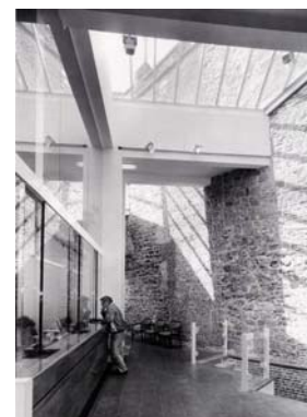
Fig. 7. Rempart du 12 e s., intégré dans un commerce du centre-ville.

Le toponyme Mons est mentionné par des documents hagiographiques relatant l'installation au 7 e s. d'un ermitage sur la colline 3 par celle qui deviendra Sainte Waudru. La localisation précise de cet oratoire n'est pas connue mais pourrait correspondre au site d'une église romane transformée en collégiale au 15 e s. et dédiée à Sainte Waudru. La première agglomération urbaine était enserrée dans une muraille au tracé réduit (environ 1 km) dont les vestiges sont encore visibles en plusieurs endroits de la ville. Elle fut édifée au 12 e s. par les comtes de Hainaut et constituait une défense avancée du château installé au sommet de la butte depuis le 10 e s.. L'économie montoise était alors liée au milieu rural. L'artisanat se développa à la fin du 12 e s. 4 . Un marché se déroulait au pied du château, un autre marché était situé hors les murs devant une porte de l'enceinte, au carrefour de routes commerçantes menant vers l'Empire germanique, le Brabant et la France 5 . L'endroit sera étendu au 14 e s. pour devenir la Grand-Place actuelle.