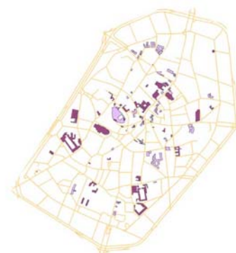
Fig. 6. Carte des zones protégées (monuments et sites classés, espaces verts et zones de parc, zonages des PCA), en cours de réalisation.