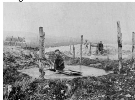
Fig. 2. Fouille des mines de Spiennes au milieu du 20 e s.

Dans la commune de Mons, 768 sites ont été inventoriés. Cette richesse archéologique provient notamment d'une recherche intense depuis le 19 e s., paradoxalement liée à l'industrialisation de la région. Le creusement de carrières dans les nappes alluviales occasionna la mise au jour de nombreux vestiges préhistoriques parmi les plus anciens de Wallonie, qui attirèrent fouilleurs et antiquaires. A la même époque, d'autres excavations liées aux travaux miniers, aux carrières et aux installations de lignes de chemin de fer ou de canaux ont occasionné la découverte et parfois la fouille de nécropoles de l'âge du Fer, d'un vicus , de quelques villae gallo-romaines, et de plusieurs cimetières mérovingiens. Les minières néolithiques de Spiennes, aujourd'hui inscrites sur la liste du patrimoine mondial de l'Unesco, firent également sensation.