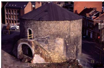
Fig. 8. La Tour valenciennoise en cours de dégagement et de restauration.

C'est à partir du 13 e s. que le plan de la ville se modifie de manière significative. Les terrains boisés furent progressivement défrichés aux 13 e et 14 e s.. Trois nouvelles paroisses sont détachées de la paroisse initiale, en des points commerciaux stratégiques 6 . La ville comptait alors 16 quartiers et était traversée par plusieurs rivières, dont la Trouille, partiellement navigable, et la Seuwe, qui servit de collecteur jusqu'au 14 e s. avant d'être comblée. La ville en expansion fut ceinturée par une fortification plus large, d'un circuit de 4-5 km présentant 6 portes. Le seul témoin encore visible en élévation est la "Tour valenciennoise" (14 e s.). Elle a fait l'objet de campagnes de fouilles et sera intégrée à un projet de mise en valeur du quartier ainsi qu'aux plans d'aménagement de nouvelles cours de justice. Aux 14 e et 15 e s., le nombre de nouvelles rues créées ainsi que le nombre de foyers augmentent 7 .