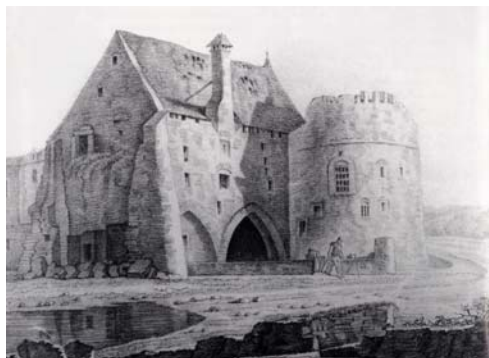
Fig. 10. Ruines de la Porte du Rivage, par laquelle la Trouille pénétrait dans la ville.

La rivière Trouille entrait dans la ville au sud-ouest et en sortait au sud-est. Des petits bateaux à fonds plats pouvaient remonter le courant et pénétrer jusqu'au lieu d'un débarcadère situé près d'une abbaye, d'où les marchandises étaient acheminées vers les marchés. Le cours était encore navigable sur quelques mètres avant de s'enliser. De nombreuses structures étaient liées à la présence du cours d'eau dans la cité : ponts, écluses, débarcadères, réservoirs, pêcheries, moulins, lavoirs, bains publics, bâtiment abritant diverses activités artisanales (tanneries, brasseries...).