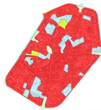
Fig. 4. Plan de secteur de Mons intra muros.

Actuellement, les demandes de permis d'urbanisme adressées au Ministère de la Région wallonne sont examinées aussi systématiquement que possible par le Service de l'Archéologie. Toutefois, depuis la mise en application d'un nouveau code de l'urbanisme en octobre 2002, le pouvoir régional s'est déforcé au profit des communes. Il en résulte un double problème : risque de perte de l'information et faiblesse des impositions archéologiques à dicter aux communes en matière d'intervention archéologique.